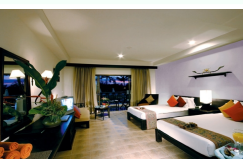
プールデラックス (+¥4,500)