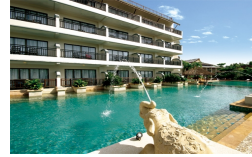
ロビー 外観 プール

ロケーション:クラビ ノッパラッタビーチ 部屋は広めで家族での滞在にも最適。アオナンの繁華街に位置しておりショッピングに便利。